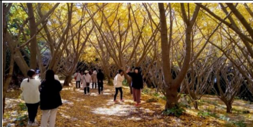
今年はタイミング良く千本イチョウを見学できました！