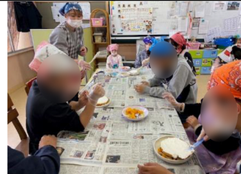
おやつクッキングの様子です。